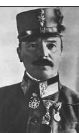
Il Generale Comandante Ludwig Goiginger. A lato: entrata locali Osservatorio.